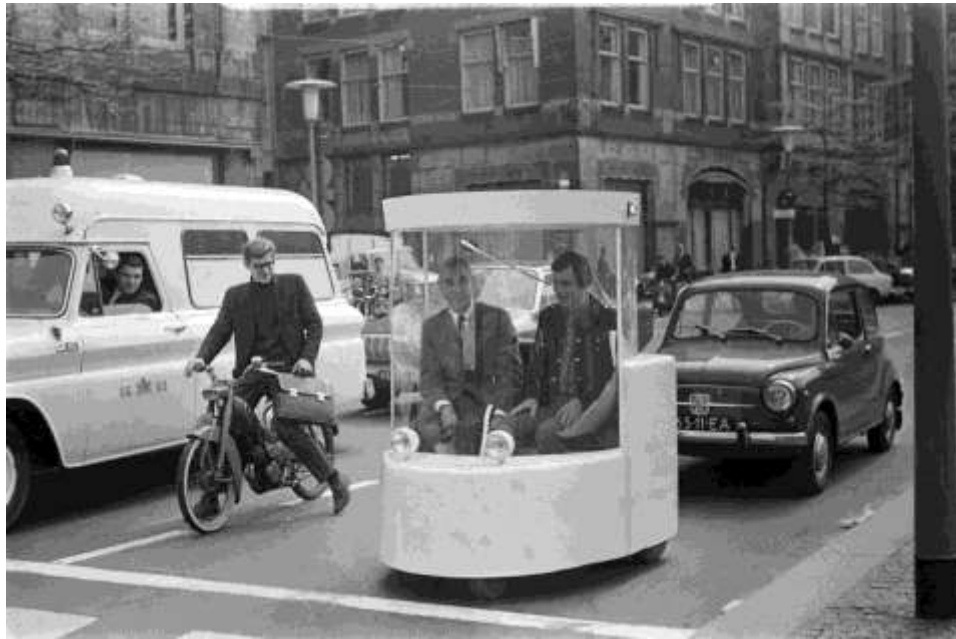
Witkar, Amsterdam 1968